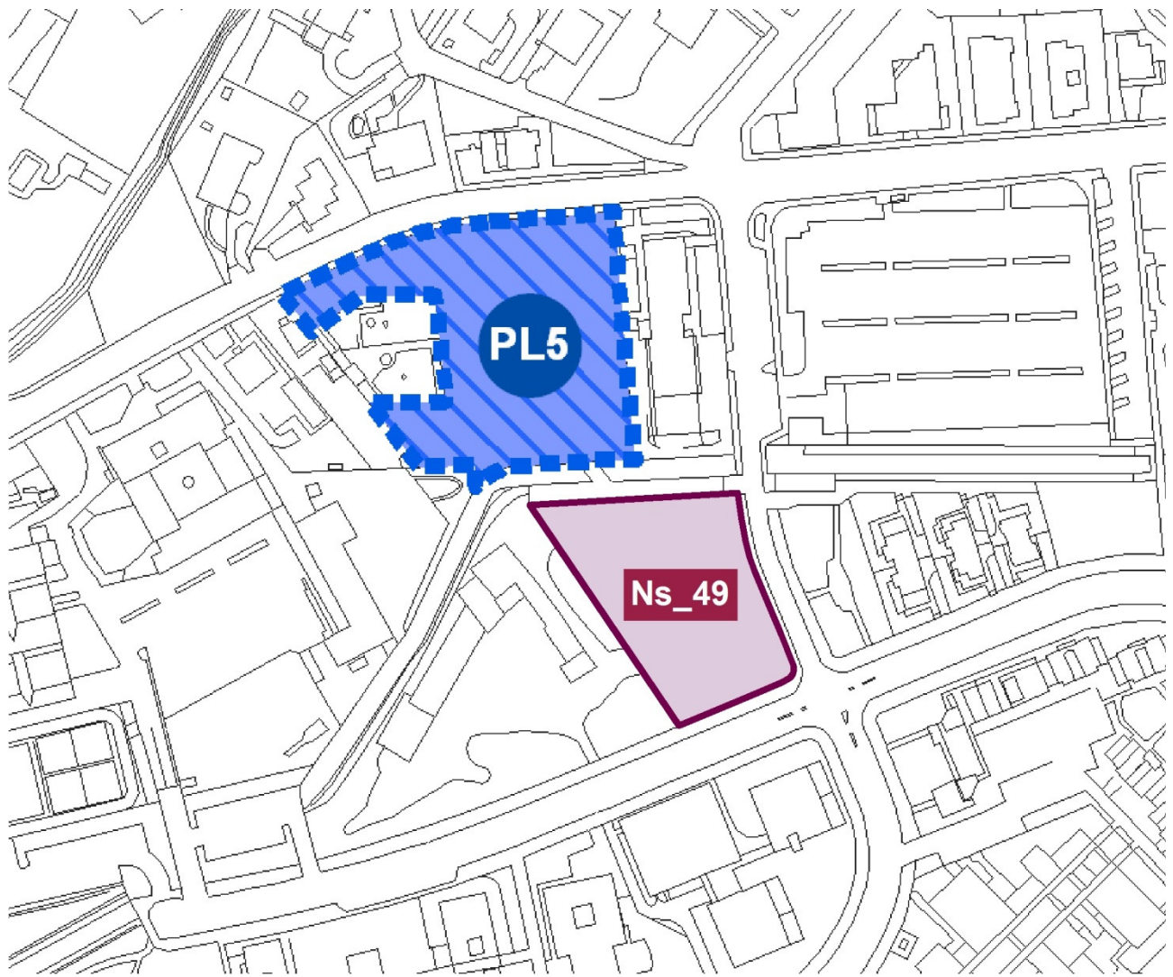
Estratto cartografico elaborato PS2bis – la città dei servizi: il progetto