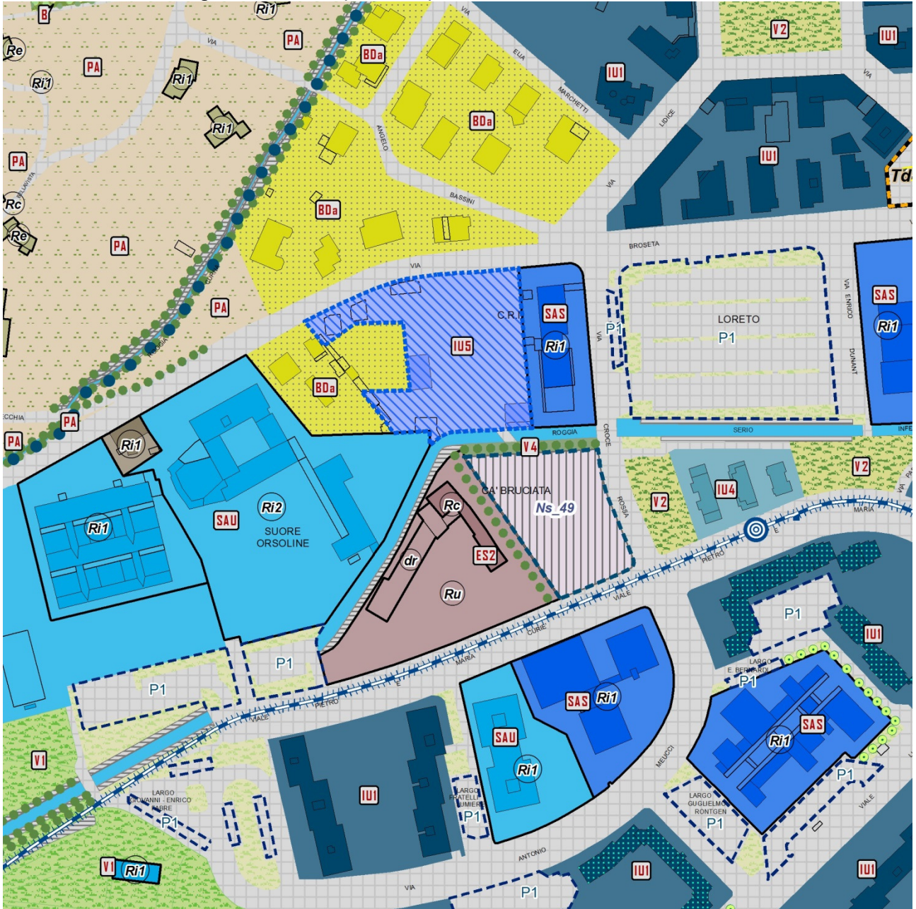
Individuazione ambito di inserimento Nuovo Servizio 49

PR7 – Assetto Urbanistico Generale scala 1:2.000